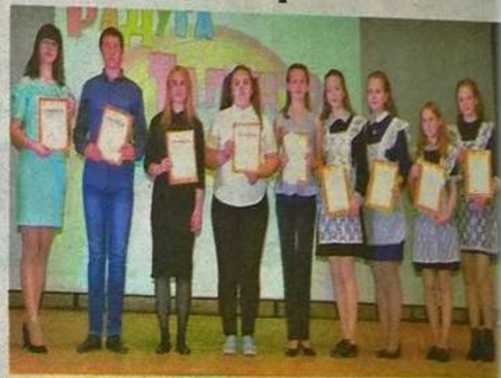
Эти ребята принимали участие в муниципальном чемпионате «Юные профессионалы» по компетенции «Учитель начальных классов».

В технопарке будущим педагогам не только рассказали, но и показали, как разрабатываются образовательные компьютерные игры, учили создавать виртуальную реальность и 3D-модели, знакомили с интересными фактами робототехники и нейроин-