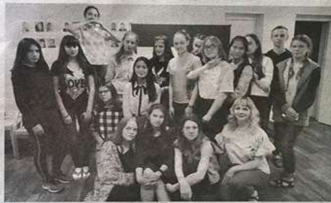
Юные оконешниковцы на профильной педагогической смене.