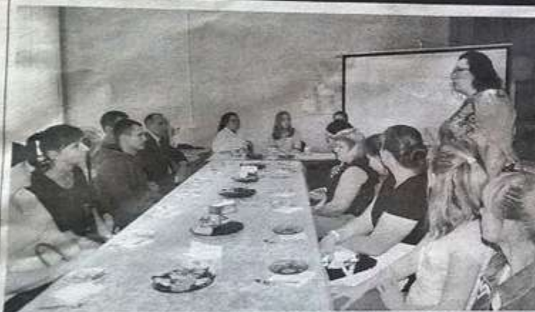
Участники встречи в рамках национального проекта «Образование».

НАЦИОНАЛЬНЫЙ ПРОЕКТ • Региональный подпроект «Будущий учитель – учитель будущего», реализуемый в Омской области в рамках национального проекта «Образование», направлен на повышение престижа педагогических профессий и интереса школьников к современной сфере образования.